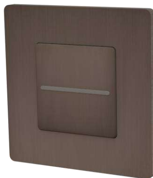
Collection « M »